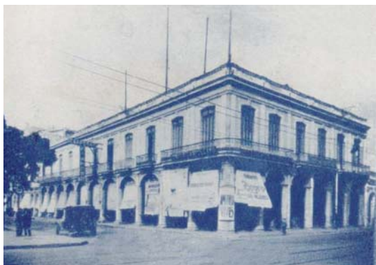
Centro Castellano - Habana

E l Centro Castellano de Cuba fue fundado el 2 de mayo de 1909, en el local del Centro Gallego o Palacio de Villalba, por un grupo de castellanos deseosos de unificar a sus comunes para mayor alivio de la nostalgia por la tierra perdida. Desde sus inicios la Asociación al Centro fue elevada, siendo así que en 1943 cuenta con más de diez mil socios con derecho electoral.