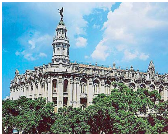
Palacio del Centro Gallego de la Habana

Las constantes peticiones de los asociados de un servicio de asistencia sanitaria, hizo que el año 1885 se llevara a la práctica el sueño de tantos, primero utilizando varias quintas existentes en la capital y después en “La Benéfica”, propiedad de la Sociedad. A partir de este momento el número de asociados crece considerablemente hasta llegar a más de 50.000 socios en el año 1920. Aunque la asistencia sanitaria y la enseñanza eran tareas de primera índole, también jugaban un papel importante otras actividades encaminadas a conservar la conexión con la tierra de